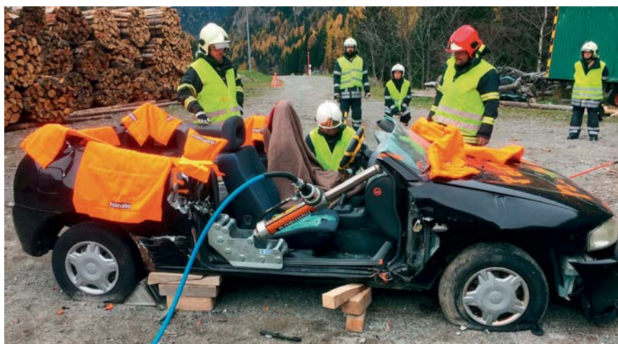
Les pompiers volontaires lors de l'exercice pratique.

Dans un premier temps, l'exactitude des plans et des installations existantes ont été vérifiées grâce à des relevés sur place. Quelques points restent encore à vérifier par des sondages. Les plans d'aménagement de la piscine et des vestiaires sont quasiment terminés.